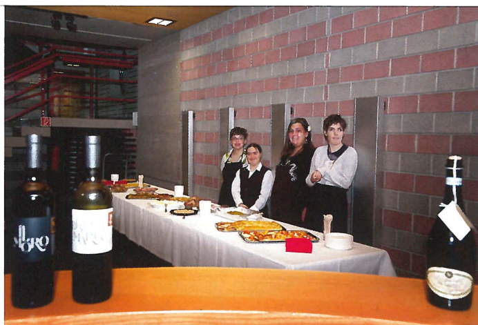
Il laboratorio Al Ronchetto aperto da Atgabbes (Associazione genitori amici di bambini bisognosi di educazione speciale) ancor prima del 1978,

«L'idea di acquistare il Canvetto, le cui mura appartenevano alle Ptt, era chiaramente un atto di salvaguardia nei confronti di un luogo simbolo della città. Inoltre vi si vedeva la possibilità di concretare un progetto innovativo: un ristorante che fosse a tutti gli effetti anche laboratorio di pasticceria. Inutile dire che fu un successo».