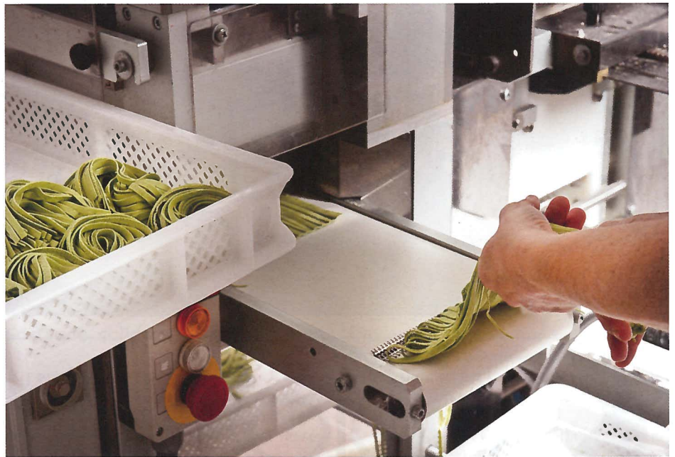
Pasta fresca fatta in casa al Canvetto Luganese.