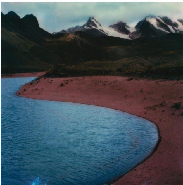
Alfio Tommasini, Ausangate, Perù.

Publicato in data 1 Febbraio 2024, 10:12